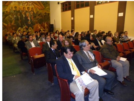
Los asistentes al acto inaugural