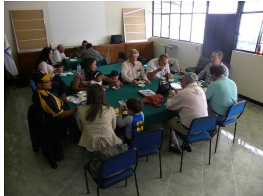
La hora del cebiche