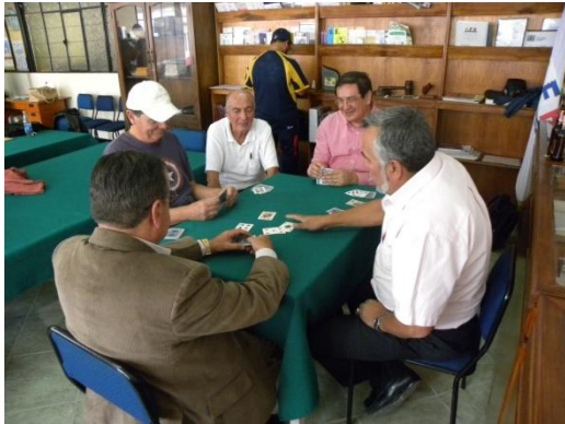
El juego de cuarenta