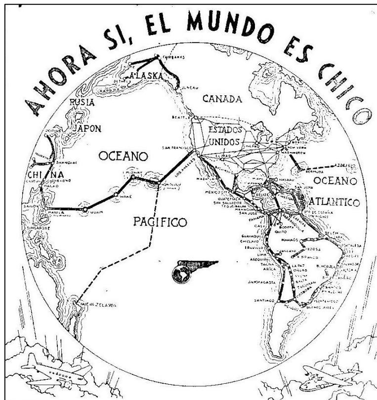
Las rutas de PANAGRA, en un aviso publicitario aparecido en el número 11 de "El Coleccionista Ecuatoriano" (junio de 1938)