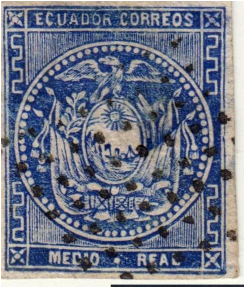
Fig 2 - Medio real autentico. Se pueden apreciar la fineza de los detalles y la alineación de los puntos en la obliteración "losange muet" (rombo mudo).