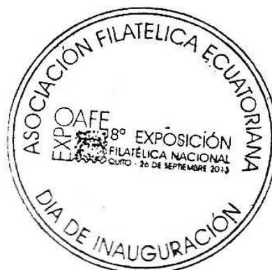
Matasellos no oficial preparado por la AFE para la ceremonia inaugural de EXPOAFE 2013