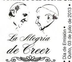
3 de julio La Alegría de Creer