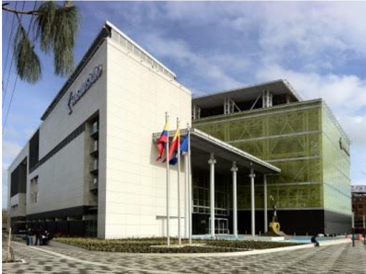
Centro Cultural "El Cubo", sede de la Segunda Exposición Filatélica del Pacífico Sur