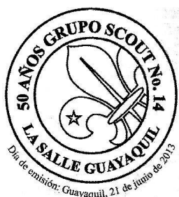
21 de junio 50 Años del Grupo Scout No. 14 - Colegio La Salle de Guayaquil