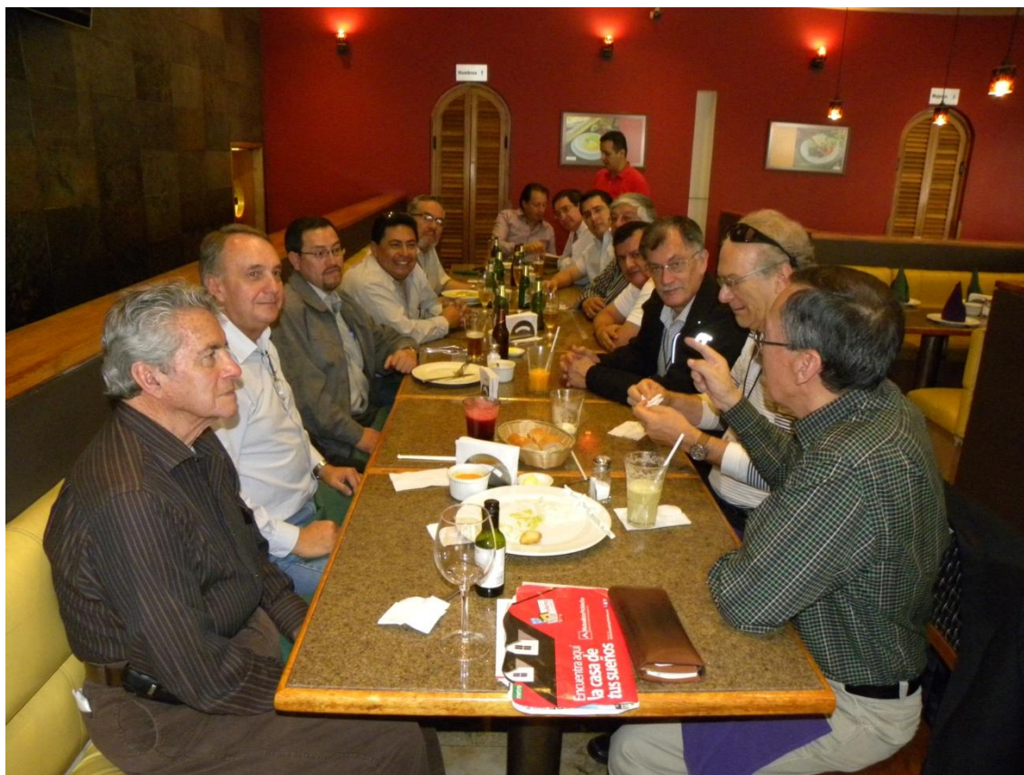
Los asistentes al almuerzo del 27 de septiembre

Con motivo de EXPOAFE 2013, estuvieron presentes en Quito colegas de Guayaquil y Cuenca, para homenajearlos, el viernes 27 de septiembre el Directorio de la Asociación Filatélica Ecuatoriana ofreció un almuerzo en el restaurante “Mi Cocina”. La reunión permitió estrechar los lazos de amistad y confraternidad filatélica entre los coleccionistas presentes en la Octava Exposición Nacional.