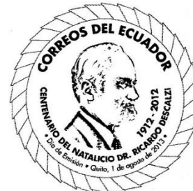
1 de agosto Centenario del Natalicio de Ricardo Descalzi