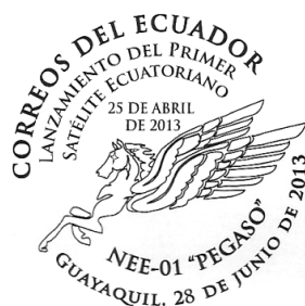
28 de junio Lanzamiento del Primer Satélite Ecuatoriano