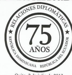
Quito, 2 de julio de 2013 2 de julio 75 Años de Relaciones Diplomáticas entre el Ecuador y la República Dominicana