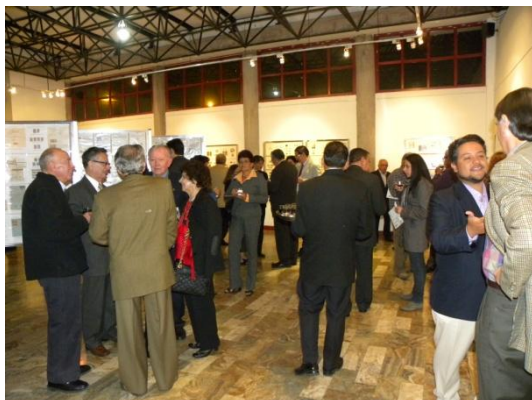
El público visita la Exposición