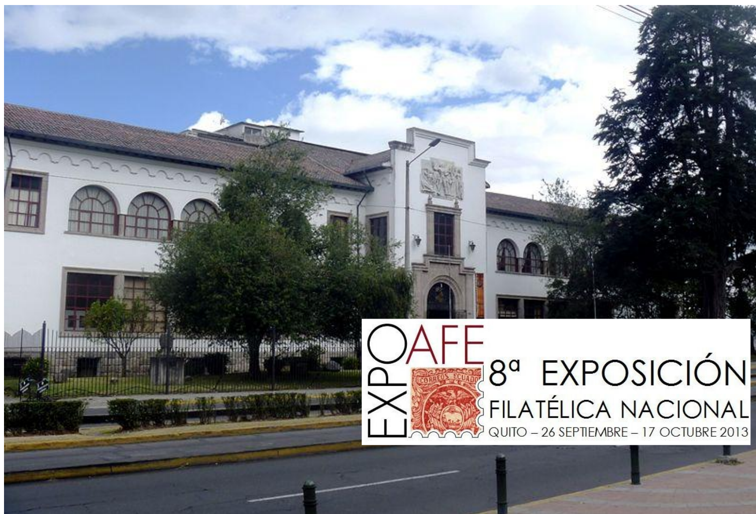
La antigua casona de la Casa de la Cultura Ecuatoriana, en Quito, sede de EXPOAFE 2013, Octava Exposición Filatélica Nacional