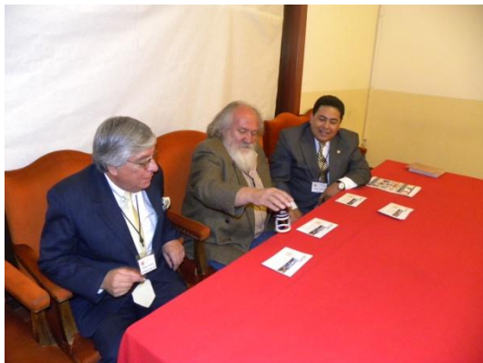
Matasellado del sobre conmemorativo