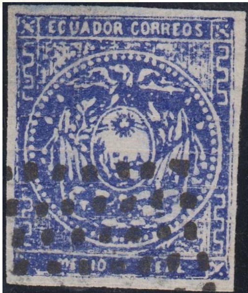
Fig 3 - Medio real cuadrículado: las letras están desalineadas y presentan grosor variable; en los cuatro ángulos, la perla toca a los cuatro pétalos; las grecas no tienen ángulos precisos y la de la izquierda, abajo, está rota y el grosor es variable; el círculo está delimitado en los cuatro ángulos por una serie de líneas verticales que deberían ser muy finas y en las dos esquinas de abajo deberían ser cincuenta por lado (aquí son solo manchas); las setenta perlas no deben tocar el círculo y deben ser redondas; el cóndor debería tener un pico retorcido y alas con plumas, también le falta una pierna; el sol debería ser redondo y no tricornio, sus rayos son palitos; todo lo que está abajo del cóndor no son dibujos sino manchas.