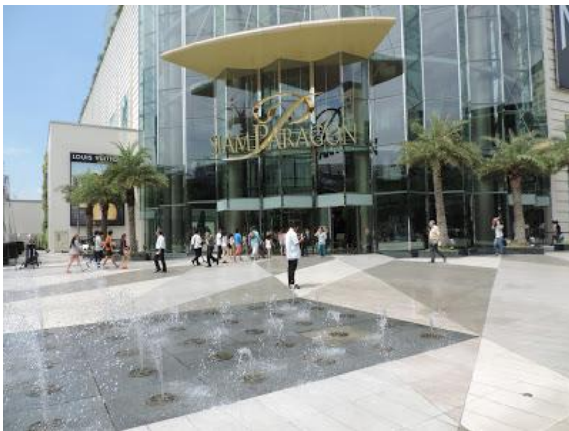
El Royal Paragon Hall, sede de Tailandia 2013