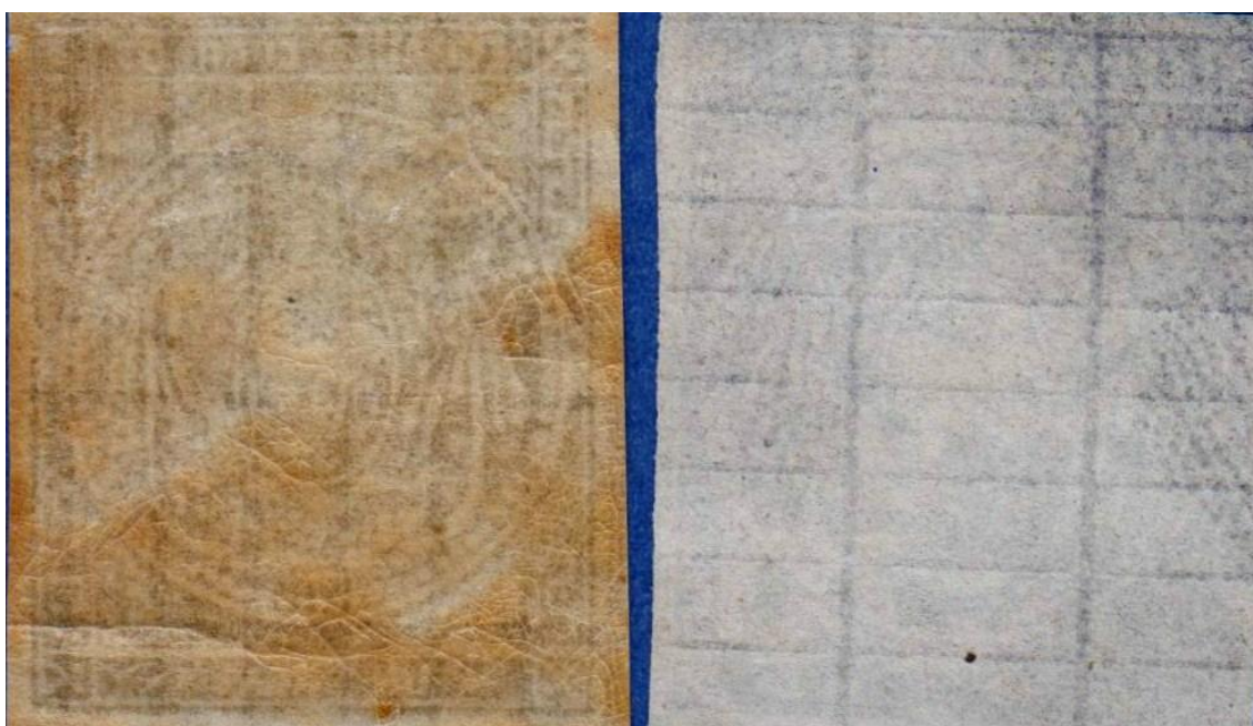
Fig. 1 - Cuadrícula de un real amarillo (izq.) y del medio real (der.)

La primera observación se refiere obviamente a los rectángulos. En el ejemplar que analicé, estos últimos están colocados horizontalmente y tienen las mismas medidas que los que aparecen en los sellos de un real amarillo (8 por 2,9 mm.); es decir, el reverso puede pasar por legítimo (figura 1).