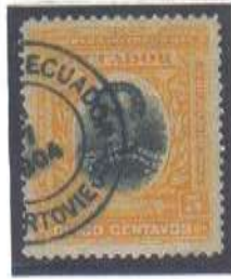
Portoviejo 1904 Original Gum