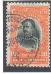
Guayaquil Seccion Exterior GTU 1904