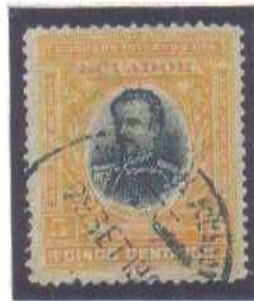
Guayaquil Interior 29 SET 1904