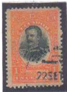
Guayaquil Seccion I 22 SET