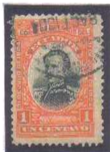
Guayaquil Scio Int r 8 AGT 1904