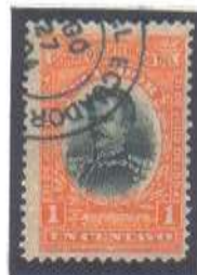
? GO 27 904