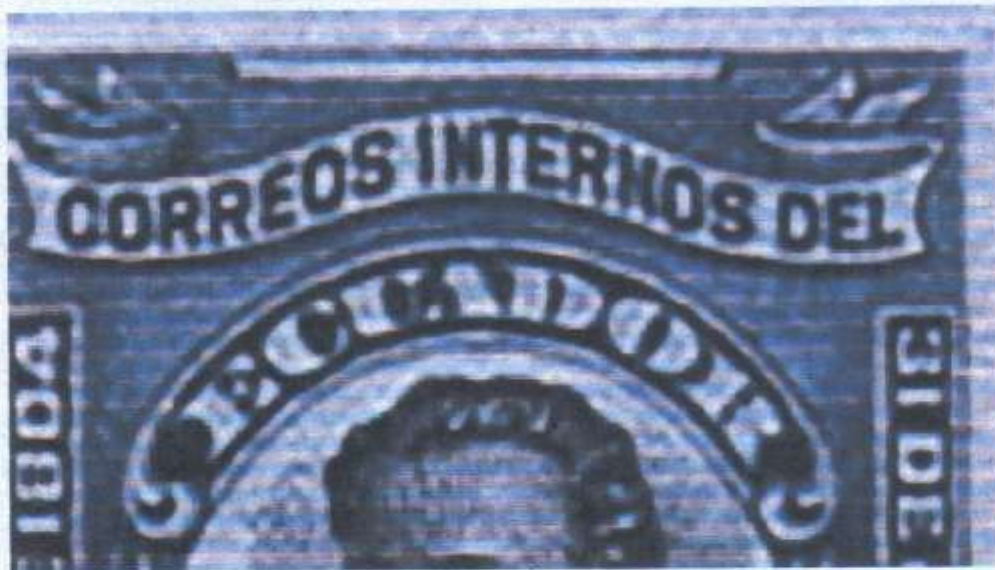
CORREOS INTERNOS DEL ECUADOR