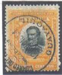
Guayaquil Seccion Exterior 12 OCT 1904