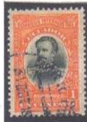
Guayaquil Seccion Exterior 31 OCT 19