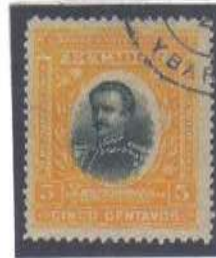
Ybarra Original gum