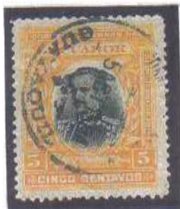
Guayaquil ec n t r 5 AGT 1904