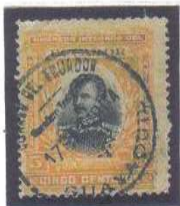
Guayaquil Seccion Interior 17 set 1904