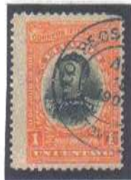
Portoviejo AG 2 190