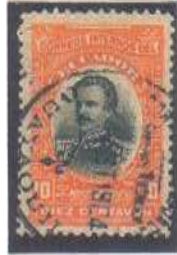
Guayaquil Seccion Exterior 20 AGT 1904

NOT AUTHORIZED FAVOR CANCELED Genuine postmark. International Mail. Obliteration used without authorization uncontemporaneously.