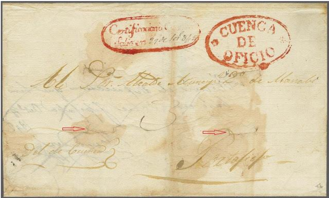
Imagen 2.- Carta certificada enviada de Cuenca a Portoviejo, vía Guayaquil. Única desinfectada que se conoce en el Ecuador

En ese entonces, las cartas eran vistas como una fuente de transmisión de enfermedades, y se tomaban medidas para prevenir posibles contagios, dada la mortandad que causaban las epidemias en un tiempo en que no se tenía conocimientos científicos suficientes como para entender o controlar las enfermedades. La desinfección de cartas era una de esas medidas.