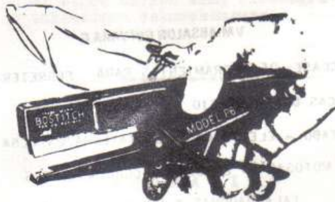
BOSTITCH P6 Stapling Plier

TENEMOS TODO TIPO DE ENGRAPADORA DE LA MUNDIALMENTE