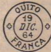
Cancelaciones inglesas y la marca ecuatoriana más usual en las cartas consulares.